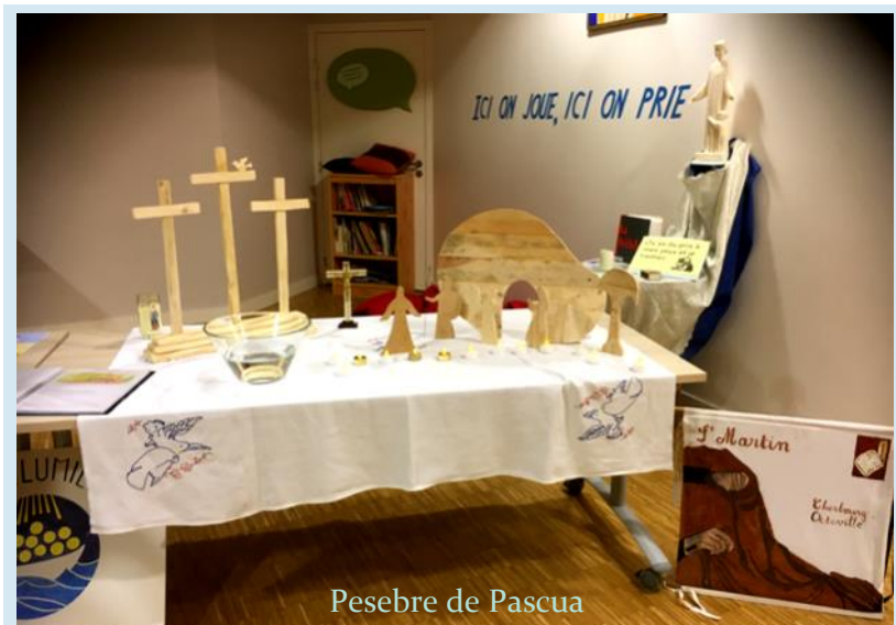
Pesebre de Pascua

En la Edad Media, el pesebre de Pascua era una forma de representar las escenas del Evangelio para las personas que no tenían acceso a las Sagradas Escrituras o que no sabían leer. En las comunidades Fe y Luz, esta representación ayuda a los corazones de la comunidad a comprender mejor la Semana Santa.”