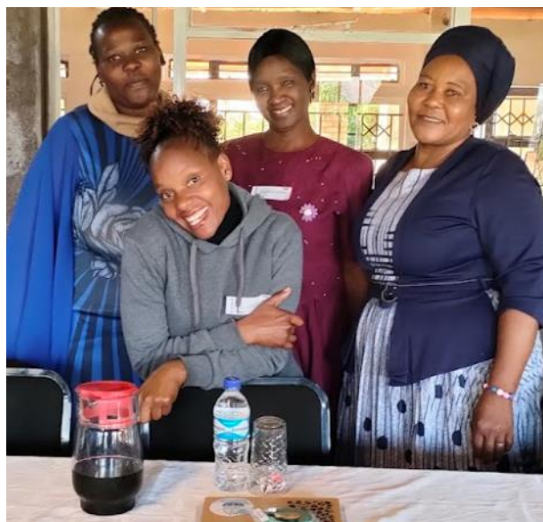
Responsables de las comunidades en Zimbabue